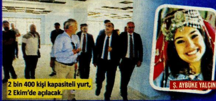
2 bin 400 kişi kapasiteli yurt, 2 Ekim'de açılacak.

Şehit öğretmen Şenay Aybüke Yalçın'ın adının verildiği 2 bin 400 kişi kapasiteli yurt, 2 Ekim'de